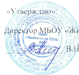
График движения школьного автобуса на 2023 – 2024 учебный год по маршруту школа с.Жилино – с.Новочесноковка — с.Жилино с.Жилино – с.Новокопылово — с.Жилино